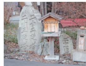
⑤月待塔 Tukimachi tower