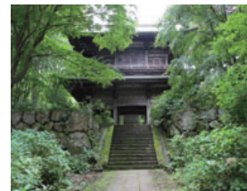
⑨-2 泰寧寺 Tainei temple

須川地区で最も大きく由緒ある須川地区で最も大きく由緒ある泰寧寺の入口に並べられたお地藏様。