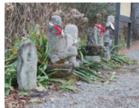
⑨-1 泰寧寺の地藏尊 Jizouson at Tainei temple

須川地区で最も大きく由緒ある須川地区で最も大きく由緒ある泰寧寺の入口に並べられたお地藏様。