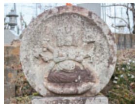
③馬頭観音 Batou Kannon

馬の供養や安全を祈願してつくられました。地元で「まるがんのん」と呼ばれています。