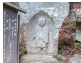
④淡島女神 Awashima megami

馬の供養や安全を祈願してつくられました。地元で「まるがんのん」と呼ばれています。