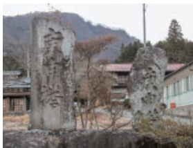
⑥庚申塔 kosin tower