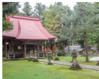
③-1 八幡宮 Hachimangu 国無形民俗文化財 盆踊り「大の版」・雪中花水祝などが行われます。境内には、二十三夜塔・猿田彦大神のほか秋葉山などの山岳神もあります。堀之内地区は、御岳山・八海山・湯殿山・富士権現など山岳神が大変多く残っています。