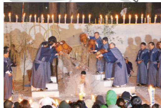
③-3 雪中花水祝 Setchu hanamizu iwai 江戸時代、鈴木牧之によって書かれた「北越雪譜」にも紹介されているこの冬の奇祭は、八幡宮にて毎年2月11日に、前年に結婚した新婦に頭から神水（冷水）をあびせ、子宝・子どもの成長・夫婦和合を願います。当日は、うまいもの市、はと市、百八灯なども行われます。