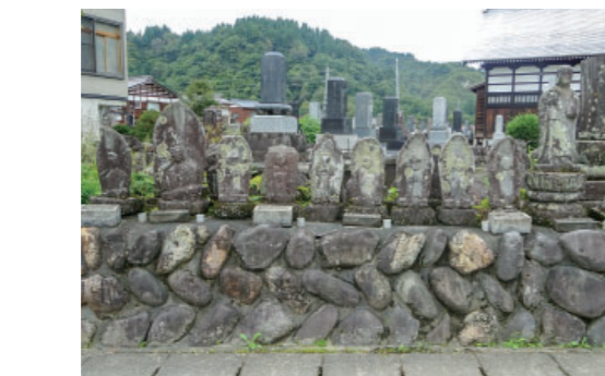
⑤-1 四日町林昌寺の石仏群 Stone Buddhist imagos at Yokkamachi Rinshyoji 道路沿いには六地藏をはじめ、地藏菩薩・如意輪観音、青面金剛、二十三夜塔などがあります。