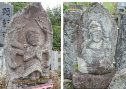
④-1 田戸墓地の青面金剛 ④-2 田戸墓地の如意輪観音 Syomenkongou at Tado cemetery Nyoirin Kannon at Tado cemetery 墓地内には青面金剛や如意輪観音が多く残っています。