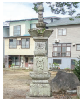
① 普賢寺の宝篋印塔 Hokyoin tower at Fugenji 塔身に立派な梵字（キリーク）が施されています。