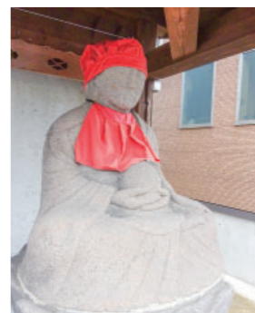
⑦ 地藏尊（火防地藏） Jizouson (Fire Prevention Jizou) 2体の地藏尊像が祀られています。明暦年間（1655-57）、上ノ原に大火があった際に、見慣れぬ若者2人の活躍で、火を食い止めることができたといわれ、後にその2人はこの2体の地藏の化身ではないかという言い伝えが残っていますが、この地藏は安政2年建立のものです。