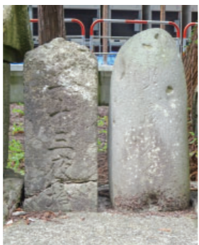
③-2 八幡宮の二十三夜塔 猿田彦大神 Nijusanya tower at Hachimangu Sarutahiko Ookami