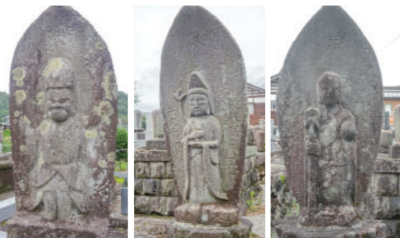
⑤-2 四日町林昌寺の馬頭観音・聖観音・地藏尊 Batou Kannon · Syo Kannon · Jizou Son at Yokkamachi Rinshyoji また、林昌寺境内には、馬頭観音・聖観音・地藏尊・薬師如来などが建立されています。