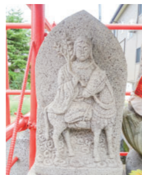
⑥ 蚕の神 God of Silkworm 「しろう神」で、「白神・四郎神」なども書かれ、東北では「おしら様」とも言います。馬に乗った娘が桑の枝を持っている御神体が祀られています。蚕の出来・不出来は稲作同様生活を左右したので、蚕の神への信仰は非常に厚いです。