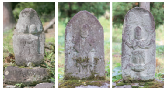
④ 菅刈の双体道祖神・庚申塔 Soutai Dousojin・kosin tower at Sugakari 双体道祖神は熊野神社の参道登り口にあります。庚申塔2体は熊野神社の裏にあり、このほかに文化3(1806)年銘のある二十三夜塔や文政10(1827)年銘のある百八十八番供養塔などもあります。