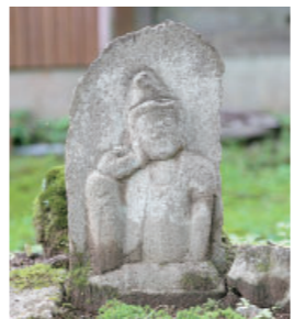
⑧ 犬伏の如意輪観音・地藏 Nyoirin Kannon・Jizou at Inubushi 犬伏集落の北東隅にある如意輪観音と地藏です。昔の焼き場跡で、このほかに六地藏や釈迦如来像などもあります。全ての地藏が立像で、右の地藏は右手に錫杖、左手に宝珠を持ち、そのほかの地藏は合掌しています。