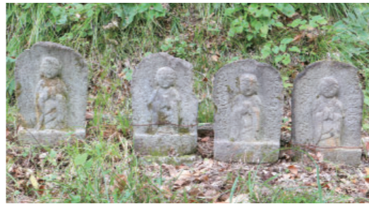
⑥ 犬伏の地藏・馬頭観音・遭難供養塔 Jizou・Batou Kannon・Evacuation Memorial tower at Inubushi 文化14(1817)年の銘があります。文化14年12月7日、他村から犬伏に嫁ぐ一行が、到着間際に雪崩に遭遇し6名が亡くなりました。その供養のために置かれた地藏で、それぞれに戒名が刻字されています。馬頭観音の頭の上には馬の頭顔部がはっきり見えます。雪崩に遭遇した馬を供養したものでしょうか。