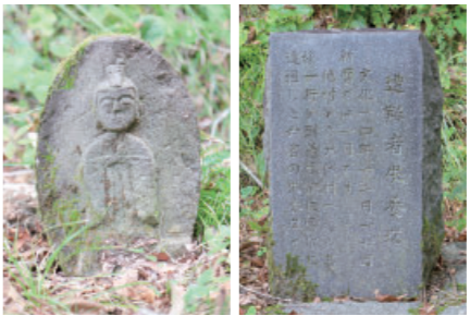
⑨ 犬伏の庚申塔 Kosin tower at Inubushi 犬伏集落南側に以前あった諏訪神社の跡地にある庚申塔2体です。