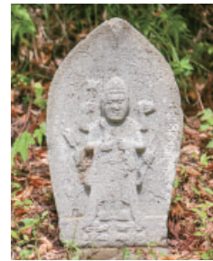
① 太平の庚申塔 Kosin tower at Taihei 太平集落の旧阿弥陀堂跡地にある庚申塔で天保14(1843)年の銘です。