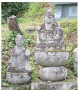
⑦ 犬伏の地藏・弥勒菩薩 Jizou・Miroku Bosatsu at Inubushi 犬伏城跡の東側登り口にあります。