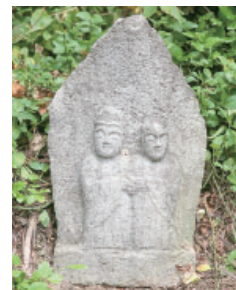
② 太平の双体道祖神 Soutai Dousojin at Taihei 太平集落では小正月にローソクや米をあげて参拝し、五穀豊穡、無病息災を祈願しています。