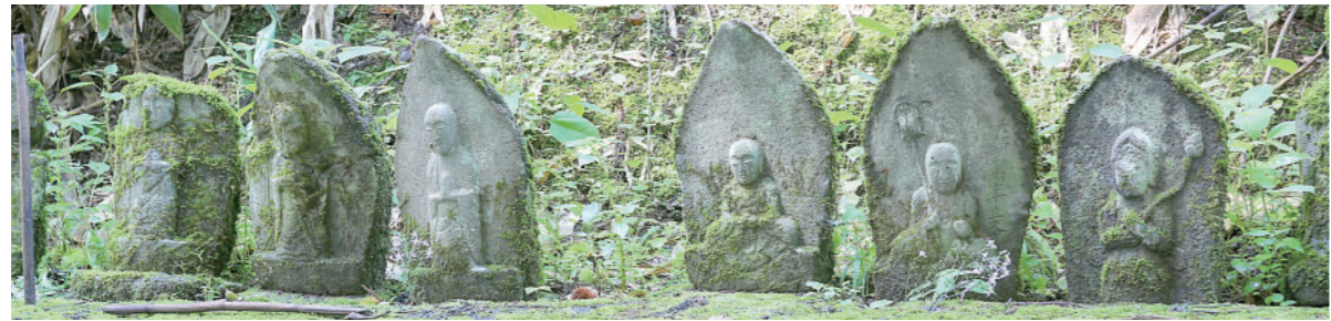
③ 菅刈の六地藏 Roku Jizou at Sugakari 菅刈集落西側の松之山街道沿いにある六地藏で、立像と座像の2種類があります。右の地藏は蓮華、右から2番目の地藏は錫杖と宝珠を手に持ち、その他は合掌している特徴があります。