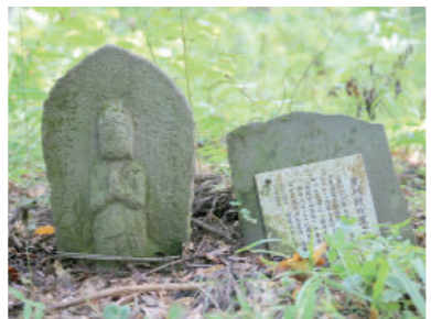
⑤ 菅刈の馬頭観音・道標 Batou Kannon・Signpost at Sugakari 菅刈集落から約1km東にある馬頭観音です。像の両端に「左松山みち、右つまりみち」と記された道しるべです。松之山街道を歩いていた人たちがこの道しるべを見かけ、松茸神社までお参りに立ち寄ったかもしれません。