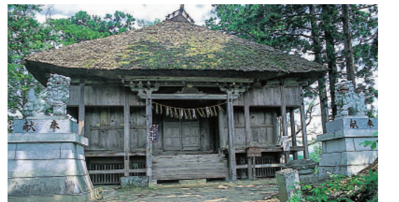
⑩ 松茸神社(国指定重要文化財) Matsuo Shrine 明応6(1497)年に建立された県内最古の萱屋根葺きの木造建築で、奴奈川姫命を祭神として坂上田村麻呂により創建されたと伝えられています。昭和53年に国指定重要文化財(建造物)に指定されました。