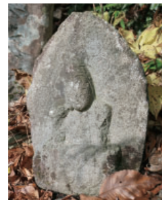
①足滝の如意輪観音 Nyoirin Kannon at Ashidaki 右ひざを立てて、右手をほほにあてているのが特徴的です。