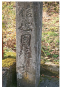
⑬信越国境碑 Shinetsu boarder monument 信濃の国と越後の国の境を示す碑です。現在も長野県と新潟県の県境になります。