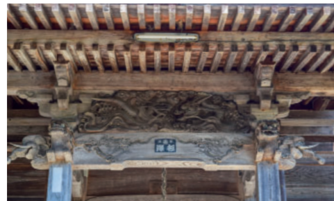
②寺石の住吉神社 Sumiyoshi Shrine at Teraishi 水に関わる神様をお祀りする神社で、素晴らしい宮彫りを見ることができます。