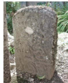
⑦寺石の蛇神 Hebigami at Teraishi 蛇の供養のために建てられた蛇神は、多くの蛇が彫られています。