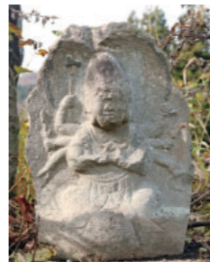
⑤寺石の馬頭観音 Batou Kannon at Teraishi 道の往來の神様であるこの馬頭観音は、顔3つ、腕が6本もある神様です。