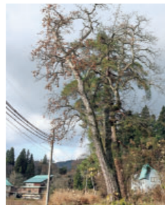
③寺石の口留め番所跡 Remained site Hush Barzutei at Teraishi 江戸時代、越後と信濃の国境であるため関所がありました。