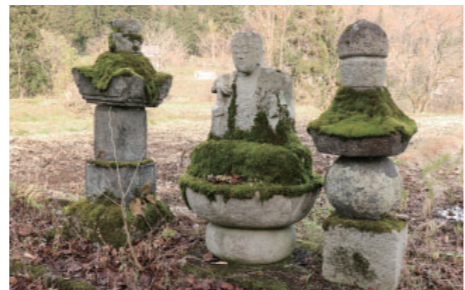
④-1 寺石の宝篋印塔・地藏菩薩・五輪塔 Houkyoin-To Jizou Bosatsu-Gorintou at Teraishi 宝篋印塔は、供養塔、仏塔の一種です。地藏菩薩は、大地の恵みを優しく育むという意味と「死者の救済」の願いがこめられています。