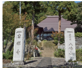
⑥寺石の吉祥寺・薬師如来(町指定)・鰐口(町指定) Kichijo Temple · Yakushi Nyorai · Waniguchi at Teraishi 寺石集落にある曹洞宗のお寺です。お寺には津南町指定文化財の平安時代の薬師如来坐像や「上野国府中窪寺薬師堂 応永五年戊寅八月廿九日各施入朝并見阿」という銘文が刻まれた鰐口が、安置されています。参道には、石仏が並びます。