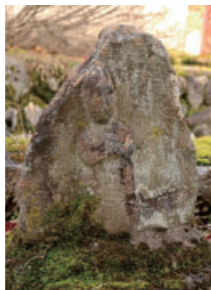
⑨越手の馬頭観音 Batou Kannon at Koshite 道の神様で、特に馬の供養の意味も持ち、頭に馬の耳が表されています。