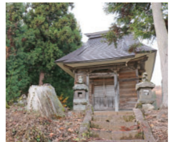
⑫羽倉の観音堂・青面金剛・地藏菩薩 Kannondou-Syomenkongou-Jizou Bosatsu at Hakura 清水観音菩薩などが安置され、安産の後利益があるとされています。