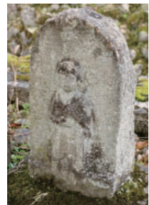
⑧越手の聖観音 Syo Kannon at Koshite 人間的な姿をし、人々を救済する神様です。