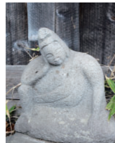
④-2 寺石の如意輪観音 Nyoirin Kannon at Teraishi 光背を持たず、ふくよかな姿が特徴的です。