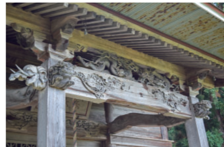
⑪羽倉の矢放神社 Yahanachi Shrine at Hakura みごとな龍や唐獅子、猿などの宮彫りを見ることができます。