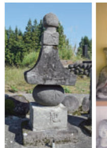
⑩羽倉の五輪塔・十王堂 Gorintou-Juoudou at Hakura 五輪塔は、地・水・火・風・空を表し、供養塔・供養墓として建てられました。十王堂では、地獄の裁判官である閻魔大王をはじめとする十王や多くの石仏が立ち並びます。