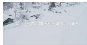
真っ白き世界に落ちた知恵に出会う